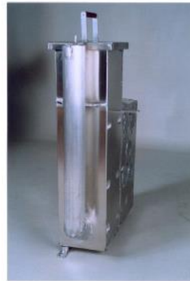
Designregistrering nr. 76686.

Åsane Sveis AS har ingen ytterligere anførsler i saken og ber om at den tas opp til avgjørelse på det foreliggende grunnlag. Når det gjelder anførselene fra Foss Metallindustrier AS, vises det til sakens dokumenter.